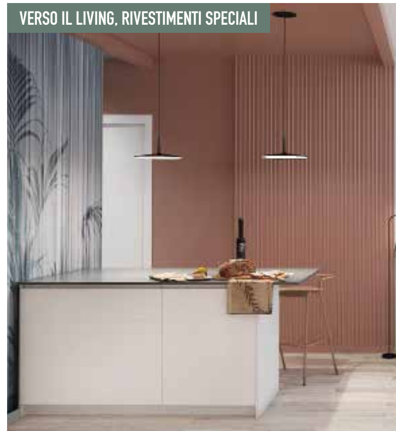
VERSO IL LIVING, RIVESTIMENTI SPECIALI

Utile per delimitare lo spazio, suddividerlo e caratterizzarlo, il colore ha anche un valore legato alla sua capacità di influenzare gli stati d'animo. In questo progetto, per esempio, il living (in basso) ospita due tonalità di verde pino, colore che esprime rigenerazione e rinascita, porta a respirare più profondamente e trasmette fiducia e sicurezza, mentre abbassa la pressione sanguigna e stimola l'ipofisi. Per questo, secondo Chroma Studio, è perfetto per la zona giorno. Nello stesso contesto, il bianco funge da tela neutra, alleggerendo l'insieme. Secondo la stessa filosofia, per la cucina è stato scelto il rosso mattone, che aumenta l'energia.