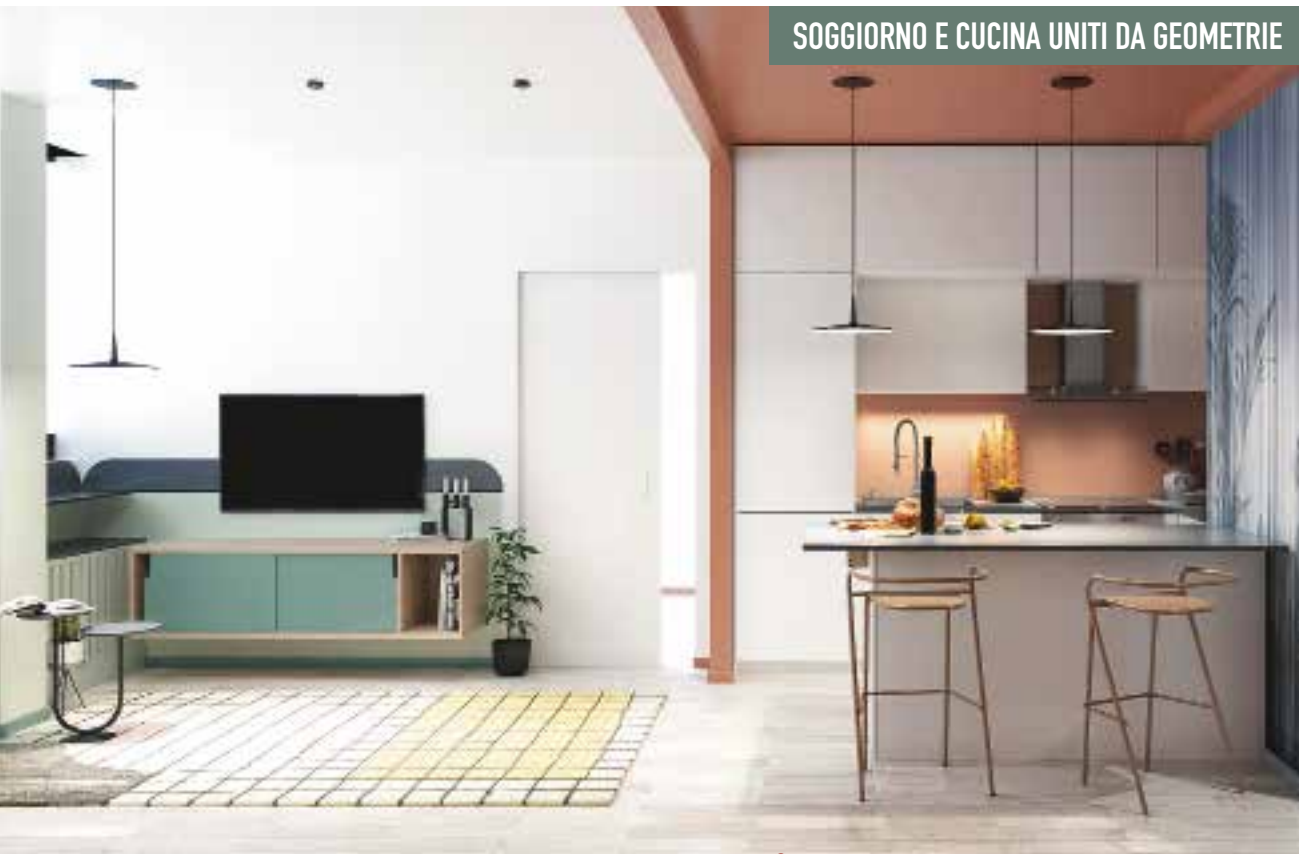
SOGGIORNO E CUCINA UNITI DA GEOMETRIE